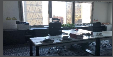
CABLEADO: PISO TÉCNICO

DETECTORES DE HUMO Y DE CALOR, HIDRANTES Y ESCALERA DE EMERGENCIA