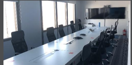
ARTEFACTOS DE ILUMINACIÓN: INCLUIDOS