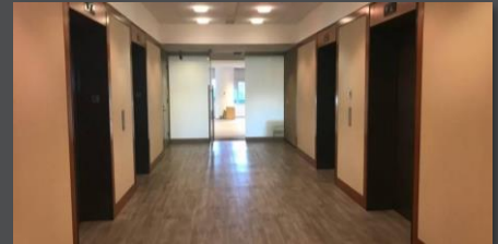
LUMINARIA: Artefactos de iluminación incluidos.