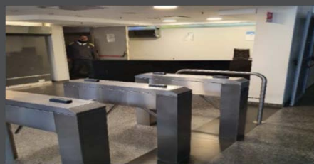
MOLINETES DE INGRESO